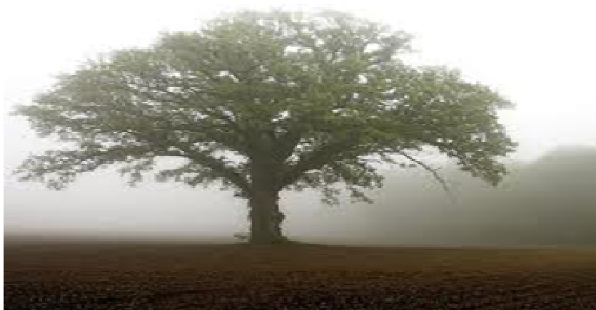
Árbol de la semilla de mostaza

Conclusión: si la conocen terminen cantando esta alabanza.