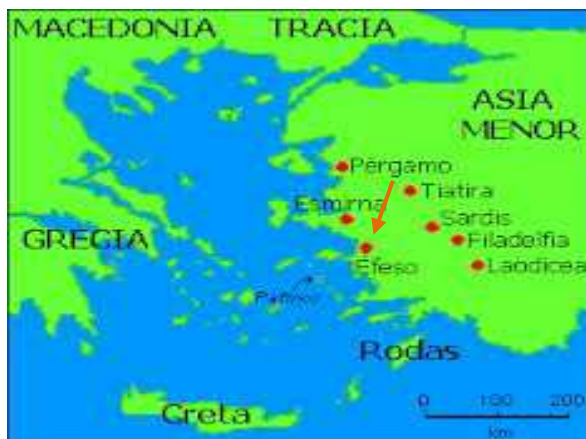
Una lectura de la Biblia

Para facilitar la comprensión y hacerla más interesante, prepara dos mapas uno antiguo y uno moderno de la zona donde está ubicada la ciudad de Éfeso, Lo que se denominaba Asia Menor y hoy es Turquía